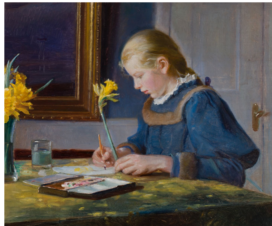
< Anna Ancher: Ung kvinde foran spejlet, 1899. Billedet af Helga er malet i sydstuen i Anchers hus.

På førstesalen i hendes værelse har hun på sengegavlen malet en prinsesse med langt hår. Omkring hende er der store blomster og slanger, der snor sig. Nederst er der to drager, der spyr ild. På servanteskuffen har Helga malet to flyvende engle, og på lågen en kvindefigur med et barn i hver hånd.