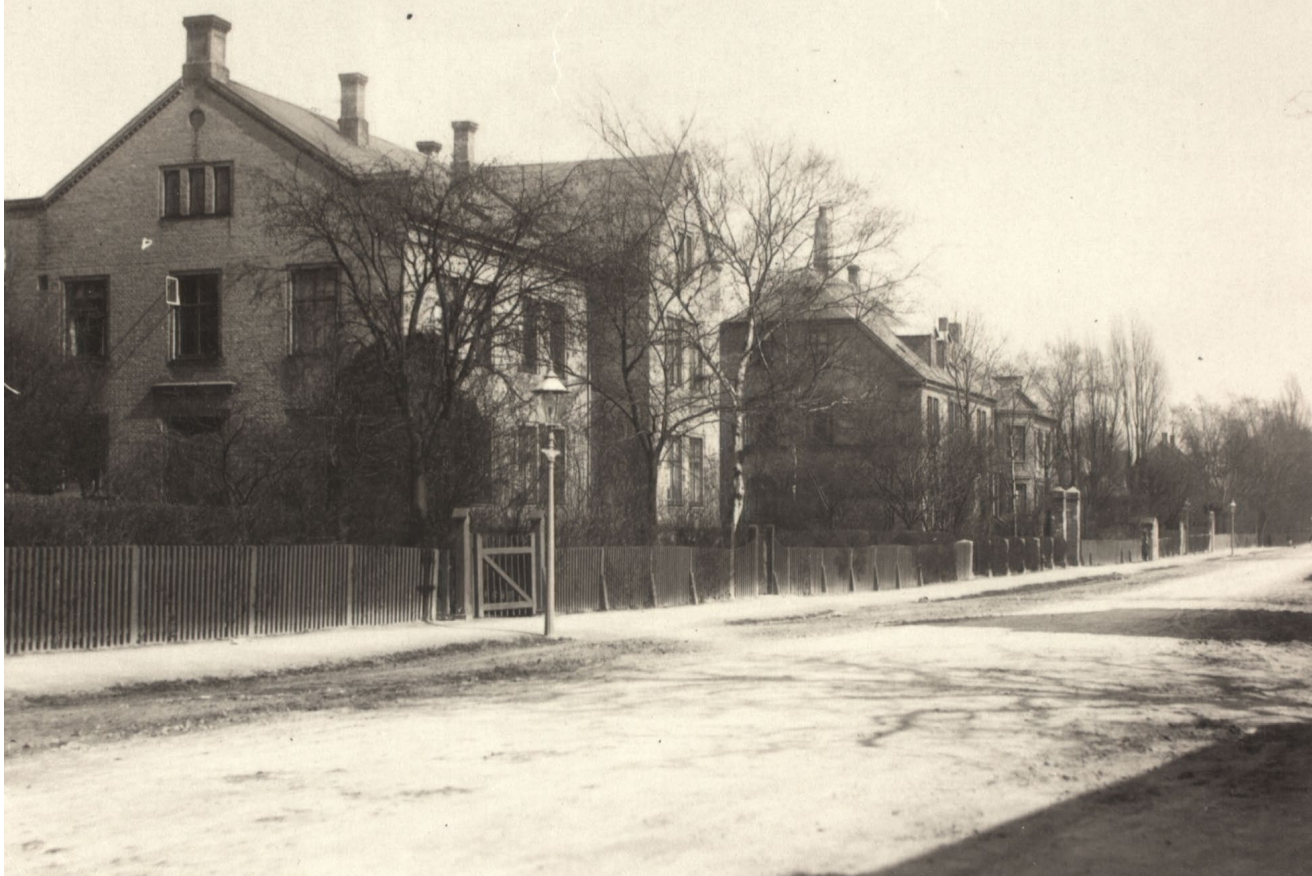
Foto fra Amalievej på Frederiksberg år 1899. Det var på denne vej, Ancherfamilien havde en villa fra 1898-1913.

ne mødes med. Derudover sparede de mange rejseudgifter samt udgifter til hotelophold.